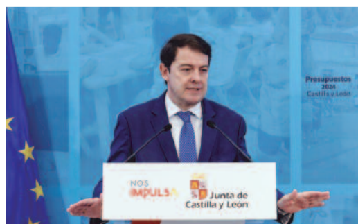
El presidente Mañueco presentó los Presupuestos de la Junta.