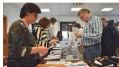
Recuento del voto exterior en Ourense.