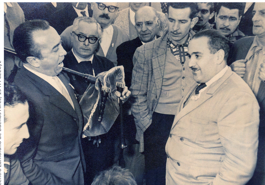
Centro Zamorano de Buenos Aires, 1947. CEECYL

http://www.catedravinculacionydesarrollo.es/ secretario.catedra@zamora.uned.es