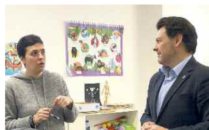
Miranda visitó el negocio de una retornada a Lugo.

NUEVA EMIGRACIÓN SUPLEMENTO ESPECIAL DE ESPAÑA EXTERIOR