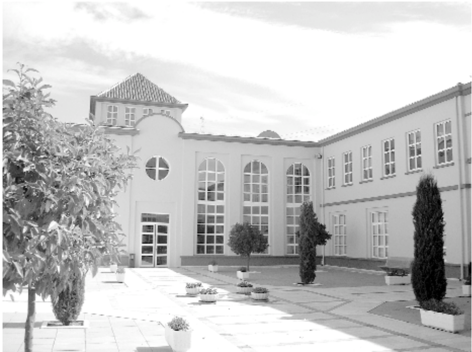
La EASP depende de la Consejería de Salud de la Junta de Andalucía y tiene su sede en Granada.

“Con los emigrantes retornados hemos contactado por dos vías; el boca a boca -una persona que nos lleva a otra y así sucesivamente- y las asociaciones