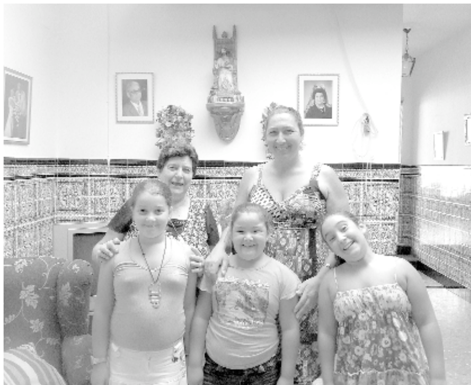
Una de las familias de retornados que ha participado en el estudio en la provincia de Cádiz.