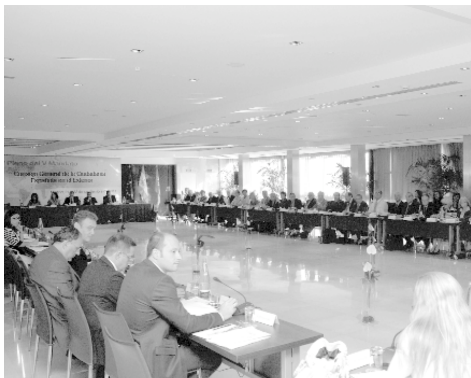
Vista general del Pleno del Consejo General de la Ciudadanía Española en el Exterior donde se expusieron estas cifras.

Si comparamos las dotaciones de los tres programa con las de