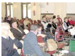
Socios de la AGER, que colaboró en el estudio.

GRUPO España Exterior - Diciembre 2011 (II)