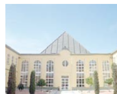
Sede de la EASP, en Granada.

La investigación confirma que la participación en las asociaciones y el voluntariado fomentan el envejecimiento saludable