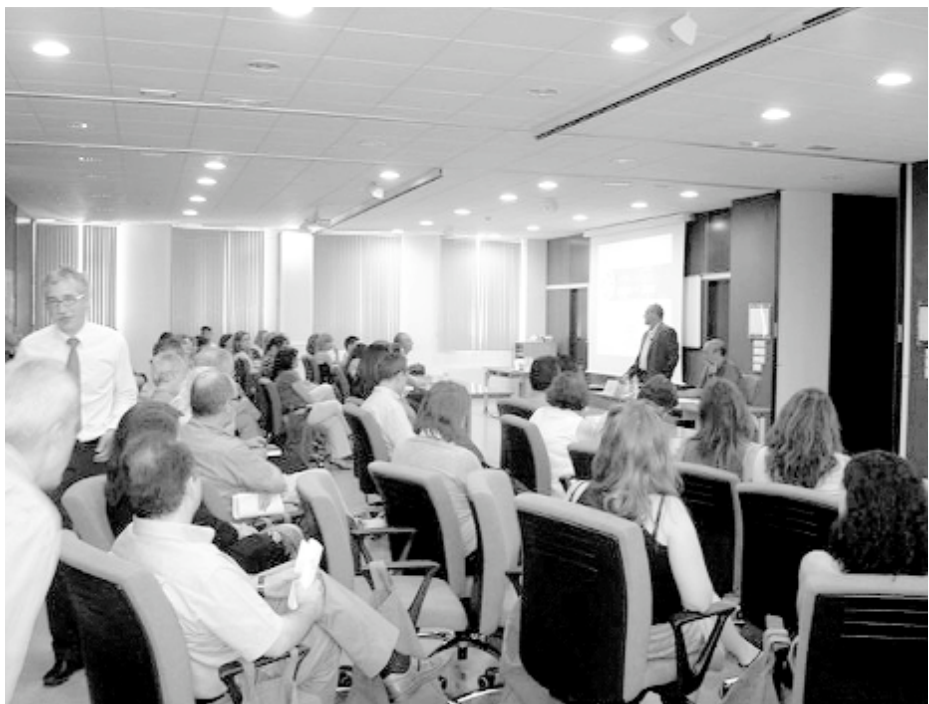
Una conferencia impartida en las dependencias de la Escuela Andaluza de Salud Pública.

de retornados. Yo, por ejemplo, estuve trabajando con la AGER de Granada, con la que todo el trabajo ha sido muy fructífero. Eran retornados esencialmente provenientes de Bélgica, Alemania y Francia”, señala González.