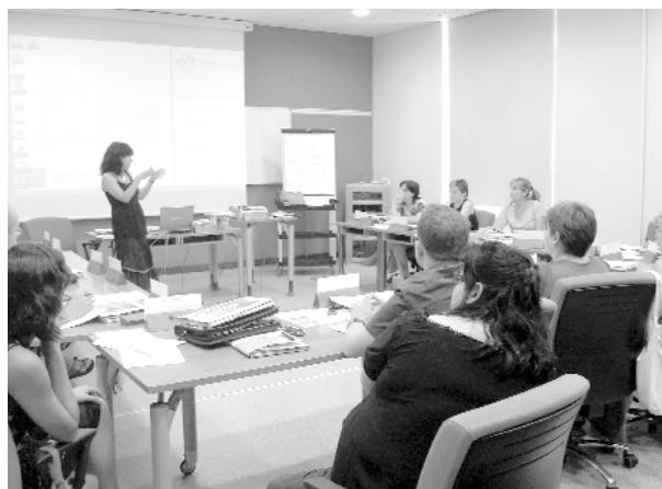
Curso de la EASP dirigido a profesionales sanitarios andaluces con el objetivo de formarlos para implantar la Escuela de Pacientes en sus centros.