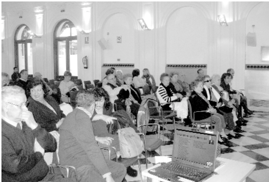
Asistentes a la jornada de voluntariado de la AGER, una de las asociaciones de retornados que han participado en el estudio.