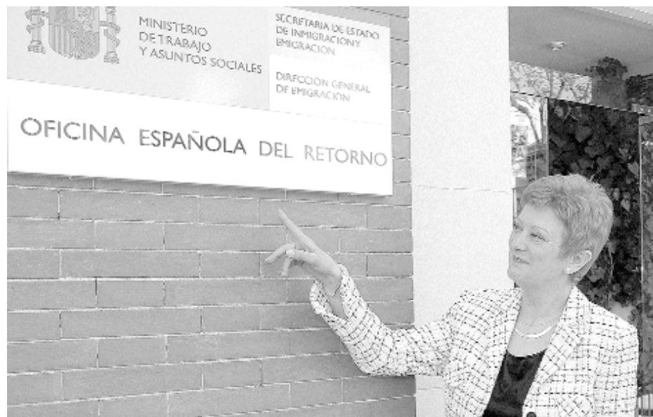
La entonces secretaria de Estado de Inmigración y Emigración, Consuelo Rumí, inauguró la Oficina Española del Retorno en 2007.