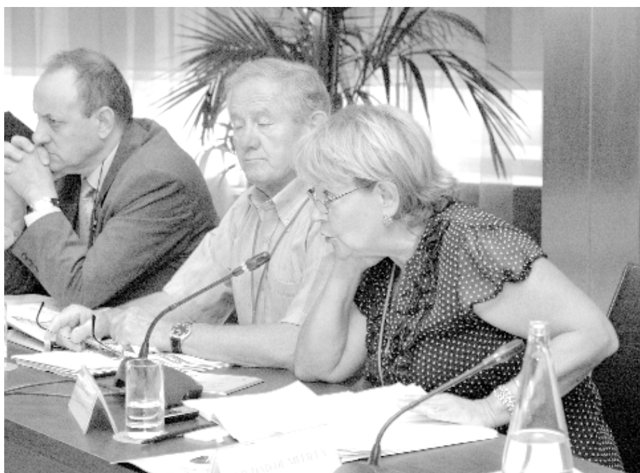
La representante de la Federación Española de Asociaciones de Emigrantes Retornados (Feaer) en el pleno del CGCEE.

las consultas recibidas han sido 1.525, lo que supone una media de 190 al mes frente al promedio mensual de 182 del año pasado, por lo que se puede decir que el número de consultas ha crecido en 8 al mes.