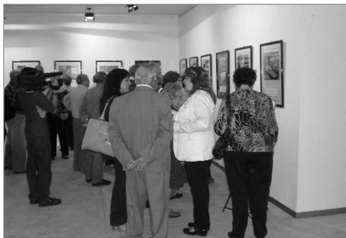
Una vista de la exposición 'La emigración andaluza: Memoria en imágenes' que organizó Agader en el Centro de Congresos de San Fernando.