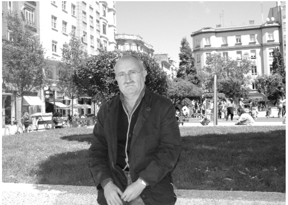
Antonio Izquierdo, catedrático de Sociología y durante 20 años representante de España ante la OCDE para las migraciones internacionales.