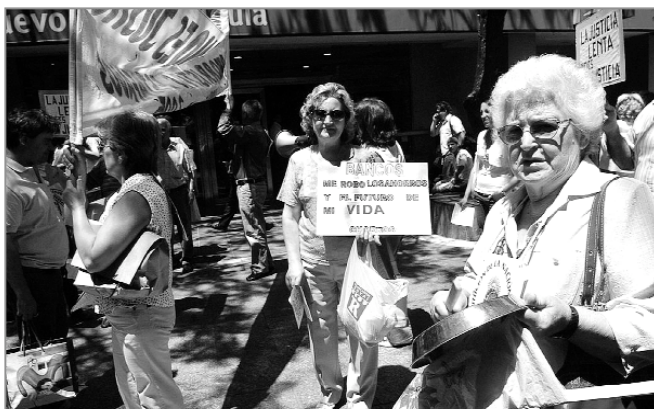
En el regreso al país pueden influir hechos inesperados, como el ‘corralito’ argentino.

RESPONSABLE DEL DEPARTAMENTO DE INMIGRACIÓN Y RETORNO DE LA CONFEDERACIÓN INTERSINDICAL GALEGA EN A CORUÑA ( HTTP://WWW.GALIZACIG.COM/AVANTAR )