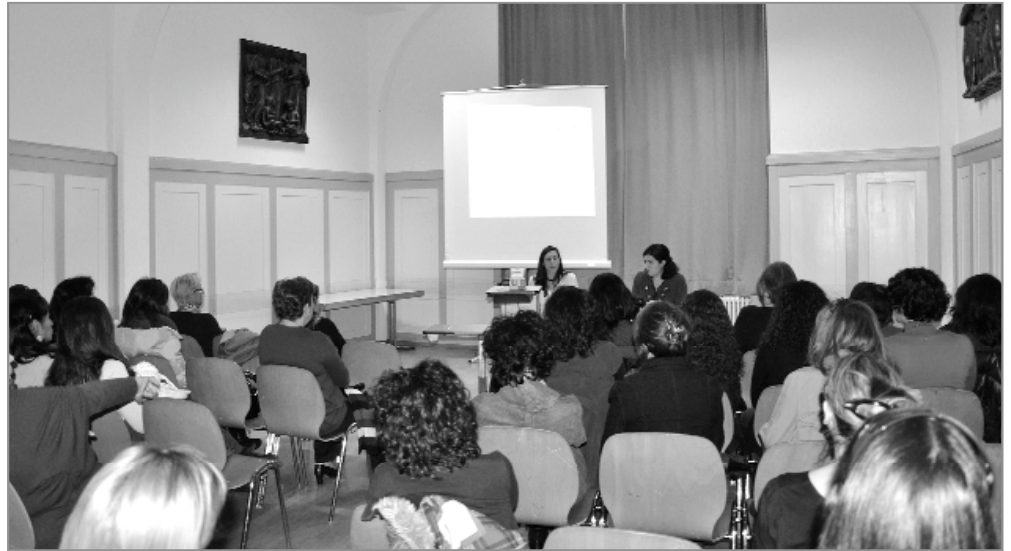
Una charla en Suiza, país en el que en 2006 se produjo un notable ascenso del retorno por una normativa local sobre pensiones.

Lo "malo" de la situación era la llegada de la democracia el 23 de enero de 1958 y la caída de la dictadura de Marcos Pérez Jiménez, que había abierto las puertas a la inmigración gallega, italiana y portuguesa para ocuparlas en la construcción de las obras públicas con