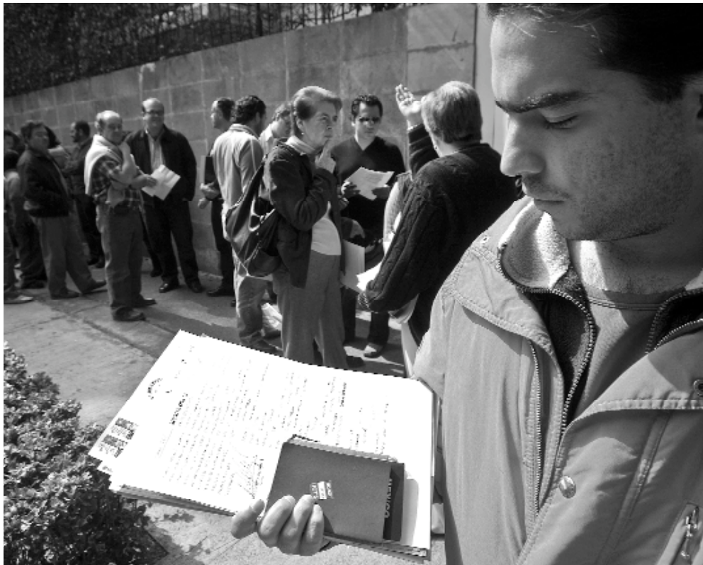
Fila de ciudadanos en la Embajada de España en México el primer día de la entrada en vigor de la Ley de Memoria Histórica.