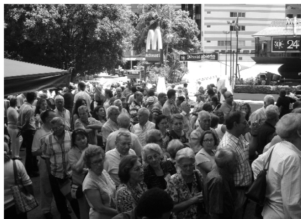
Colas ante el Consulado en Venezuela, en este caso por las elecciones al CRE.

nales en el retorno, por los países de procedencia es fácil identificar un perfil de trabajadores cualificados con movilidad laboral en sus empresas y multinacionales o de estudiantes que salen fuera a formarse, aunque tampoco habría que descartar, sobre todo en América, el acceso a la nacionalidad española de los descendientes de emigrantes a raíz de la aplicación de la Ley de Memoria Histórica. Este hecho es trasladable, en especial, a Cuba, que invierte su tendencia a la bajada de los últimos años y crece desde 2007, sobre todo, pasando de 1.398 a 1.848 en 2009. Diferencia sustancial sobre los 1.034 de 2002.