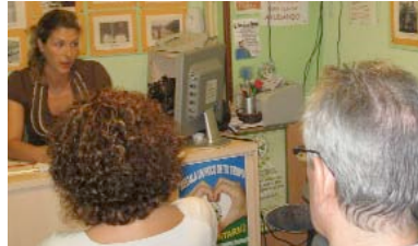
Charlas de formación que imparte Asaler.

INVESTIGA EL IMPACTO DE LA LEY DE MEMORIA HISTÓRICA