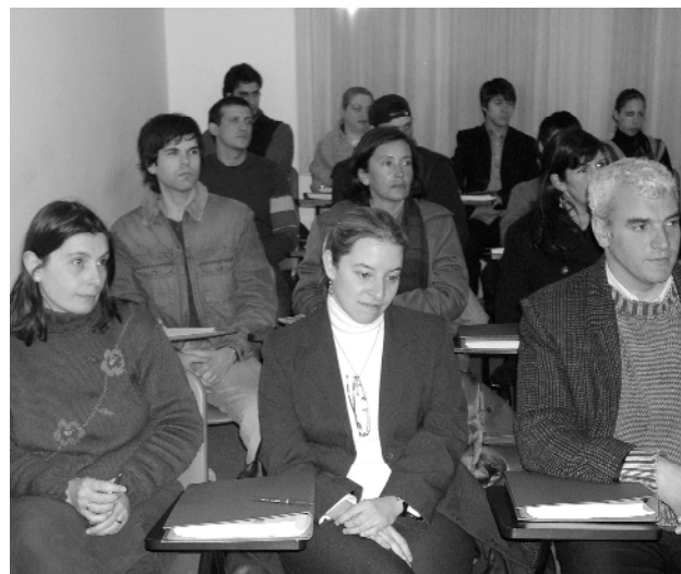
Un grupo de emigrantes en Uruguay siguiendo uno de los cursos de formación que imparte el Gobierno español para mejorar las posibilidades laborales de cara al retorno.

En cuanto a las regiones del mundo de los que procedían en 2009 estos emigrantes españoles que volvieron a Galicia, la mayor parte de ellos estaban instalados en países centroamericanos y sudamericanos, seguidos de aquellos que llegaron de estados de la Unión Europea. La situación es la misma que en el año 2002 en el caso de la región que más retornados aporta, pero no en el de la que ocupa la segunda oposición, ya que en 2002 a los países centro y sudamericanos le seguían los europeos no comunitarios, que no forman parte de la Unión Europea, donde se incluye a Suiza, que en 2009 pasa a situarse en la tercera posición.