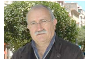
Izquierdo es catedrático de Sociología.