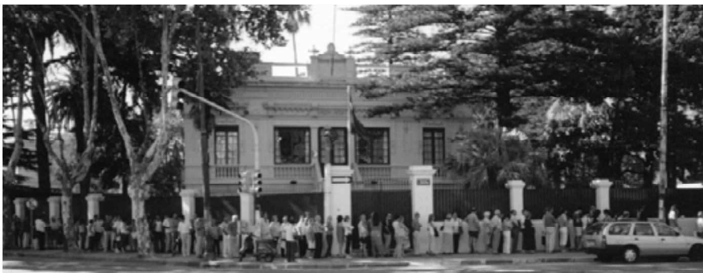
Colas ante la Embajada de España en Montevideo (Uruguay) para realizar trámites y tener la documentación en regla.