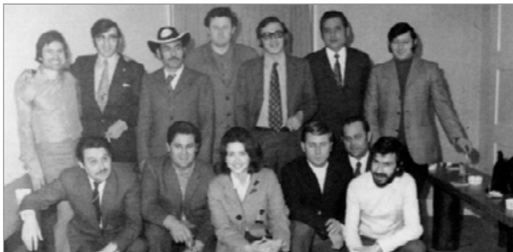
Junta Directiva del Club Español del Birsek (Dornach, 1973).

La realidad avala las conclusiones establecidas por los entrevistadores ya que muchos emigrantes coinciden en afirmar que el idioma ha sido una barrera muy difícil de franquear, agravada por su escasa formación académica. Dependencia y aislamiento son las consecuencias más comunes del desconocimiento de la lengua -en este caso ale-