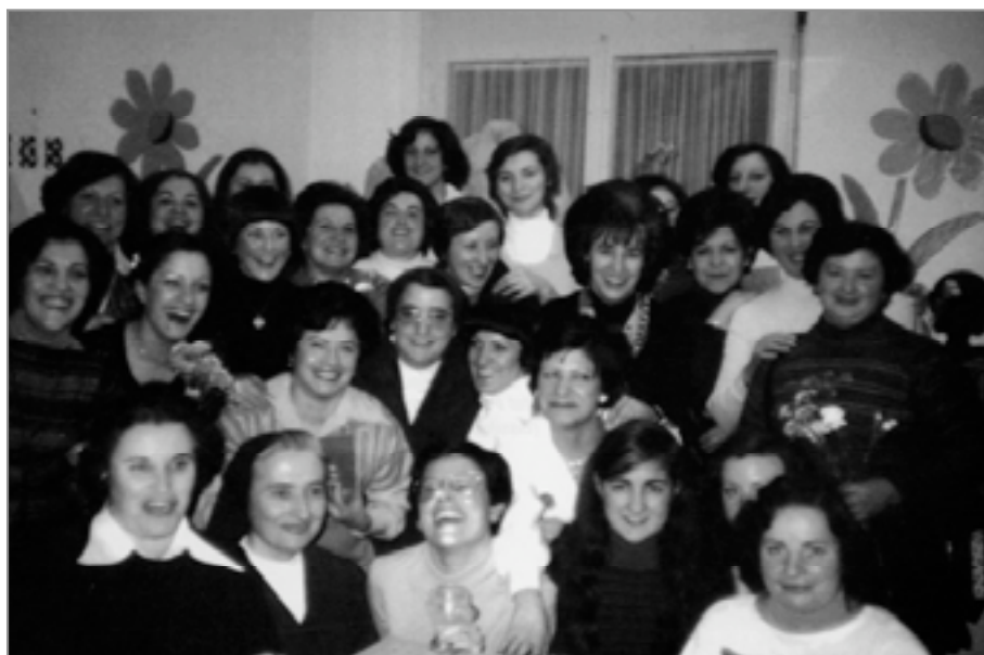
Curso de Corte y Confección en la Misión Católica Española (Basilea, 1972).

"Hasta mediados de los años 60, casi la totalidad de los españoles que viajaban a Suiza lo hacían como trabajadores extranjeros temporeros"