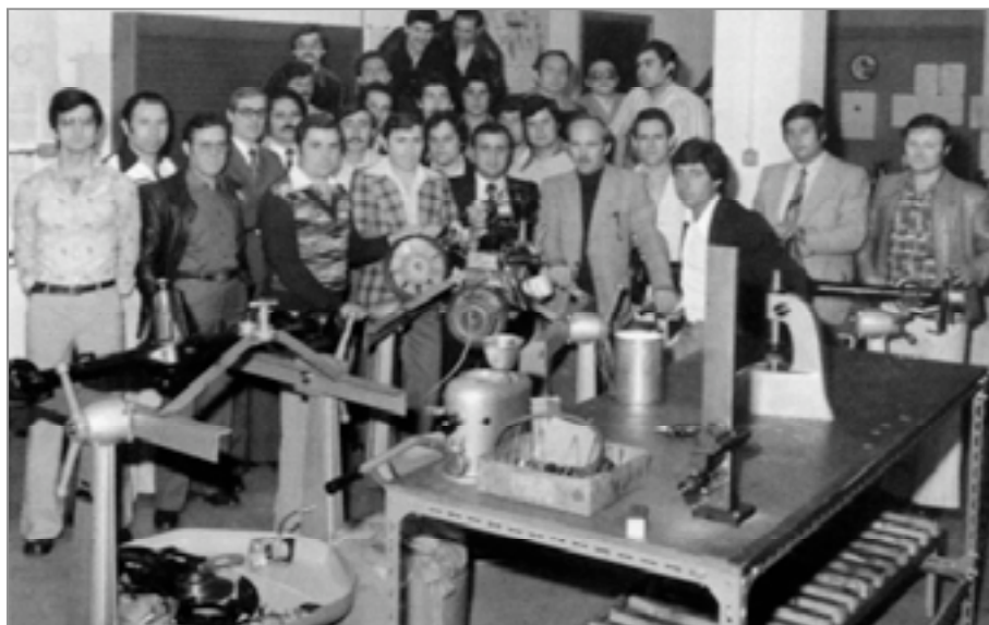
Curso de formación profesional organizado por la Consejería de Trabajo (Basilea, 1980).

Seis de cada diez pensionistas encuestados en Basilea obtiene sus ingresos de dos fuentes de cotización distintas. Una de ellas es el Seguro de Vejez y Supervivencia e Invalidez, de carácter obligatorio, y el segundo es el Seguro de Previsión Profesional que corresponde a cajas de pensiones dependientes de la empresa. Tres pensionistas de cada diez sobreviven con el primer pilar citado y los cuatro restantes reciben su pensión de tres fuentes distintas. Dos de ellas son las nombradas con anterioridad y la que falta es el Plan privado, de carácter voluntario y que tiene como objetivo mejorar el nivel de vida de los jubilados. Teniendo en cuenta estos datos y otras estadísticas relacionadas, la asociación Arco Iris estimó que el 30% de los emigrantes de Basilea, en su mayoría mujeres, vive al límite o con problemas para llegar a fin de mes. Nada que ver con aquellos años en los que el cuerpo, todavía joven y lozano, soportaba "cuantas horas extraordinarias -de trabajo- fuera posible para ahorrar" y así poder vivir con relativa comodidad.