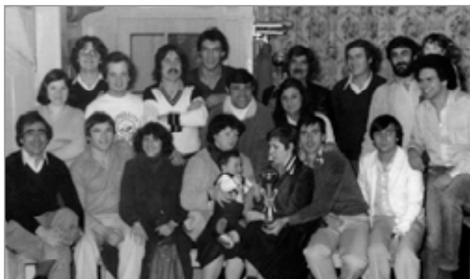
Grupo Rías Baixas. Cantina de Benk (Riehen, 1978).

mana, para más irri-. Actualmente, sólo un 40% de los residentes en Basilea se comunica sin problemas en la lengua o dialecto de la región. Las mujeres son el colectivo que presenta más dificultades de expresión debido sobre todo a su deficiente cultura -sólo un 18% afirma haber asistido a la escuela, frente al 32% en el caso de los hombres-. Aunque los datos no son del todo correctos, ya que algunos de los entrevistados, en su mayoría pertenecientes al sector masculino, “tendían a valori-