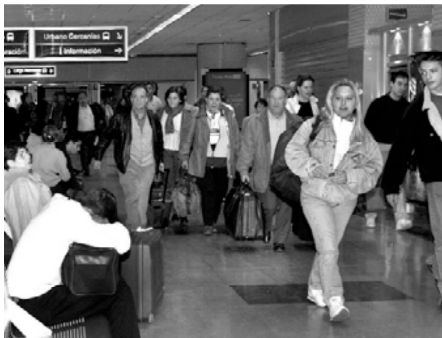
Las personas llegadas de Latinoamérica se sorprenden con el hecho de que las partidas de nacimiento caducan en España.

Esta administración doble trae problemas a los recién llegados porque, en algunos casos, normas