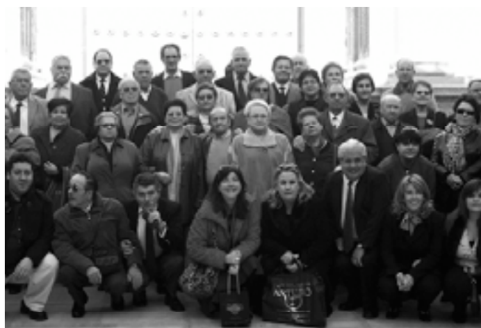
Un grupo de emigrantes retornados ante el Parlamento andaluz tras una visita a sus instalaciones.

analizarán más adelante las causas de este giro, cabe ya anticipar una mejora de la situación económica, social o incluso política en países como Argentina, sobre todo, Uruguay, México, Cuba o Colombia para que descienda el número de emigrantes retornados afectando al global del continente. También disminuyen las bajas consulares en Venezuela aunque, junto con Argentina, se mantiene entre los seis países con más casos de vueltas a los orígenes.