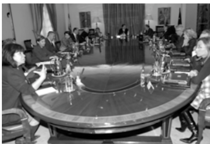
El Consejo de Ministros aprobó, en su reunión del pasado 11 de enero, el nuevo decreto de prestaciones por razón de necesidad que incluye a los emigrantes retornados.

Por otra parte, existen también ayudas para información y asesoramiento a