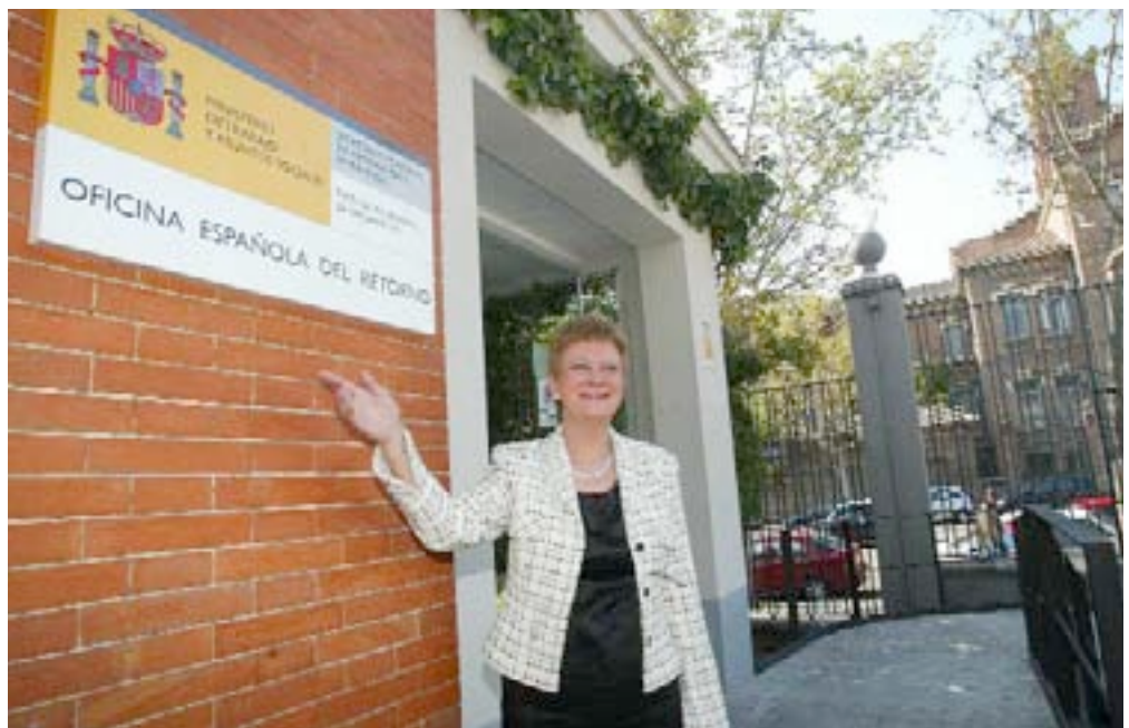
La secretaria de Estado de Inmigración y Emigración, Consuelo Rumí, en la inauguración de la Oficina del Retorno.

Con estos propósitos, la secretaria de Estado de Inmigración y Emigración, Consuelo Rumí, inauguró en abril de 2007 esta Oficina en dependencias de su departamento, del Ministerio de Trabajo y Asuntos Sociales. Y desde entonces, más de 360 españoles que viven fuera del país han mostrado su intención de regresar, iniciando el trámite en la Oficina del Retorno, y la mayoría de ellos son trabajadores que buscan un empleo en España. Según los últimos